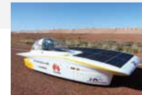
Sonnenwagen: © Team Sonnenwagen