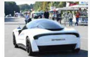
speedE: © TEMA AG